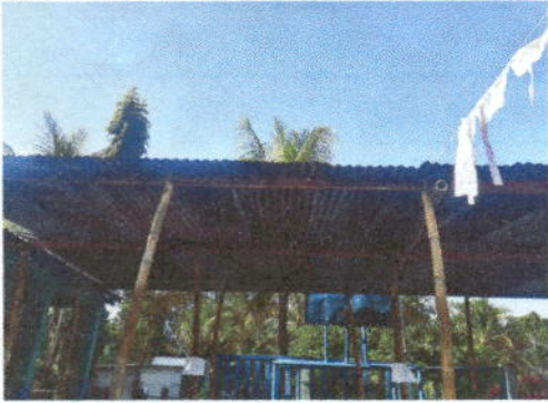
Foto 1: Sustrucción de lámina por lámina troquelada aluzinc calibre 26 mas sustrucción de estructura de soporte de metal por metal.